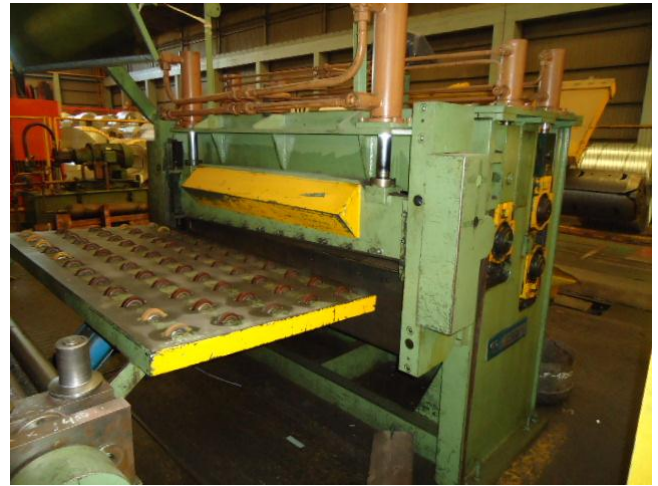
Procesador con enderezadora y guillotina