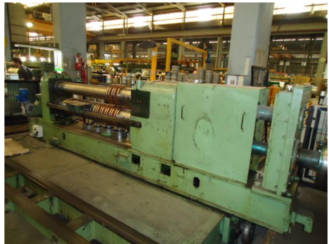
Garaje de cizallas con cizalla para montar